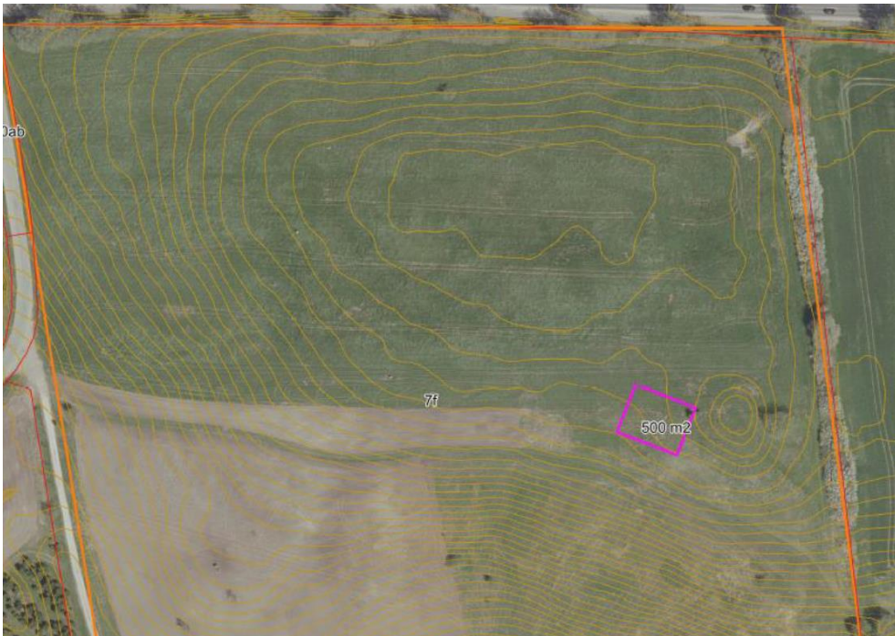
Kort 1 viser med lilla området hvor biocoveret bliver udlagt

Området består af den afsluttede Uggeløse Losseplads, som i dag er dækket af jord. Området fungerer i dag som delvist hobby landbrug (dyrkning af græs) og som rekreativt område. Udlægning af biocover vil ikke hindre brugen af området som fritsomsområde eller landbrug.